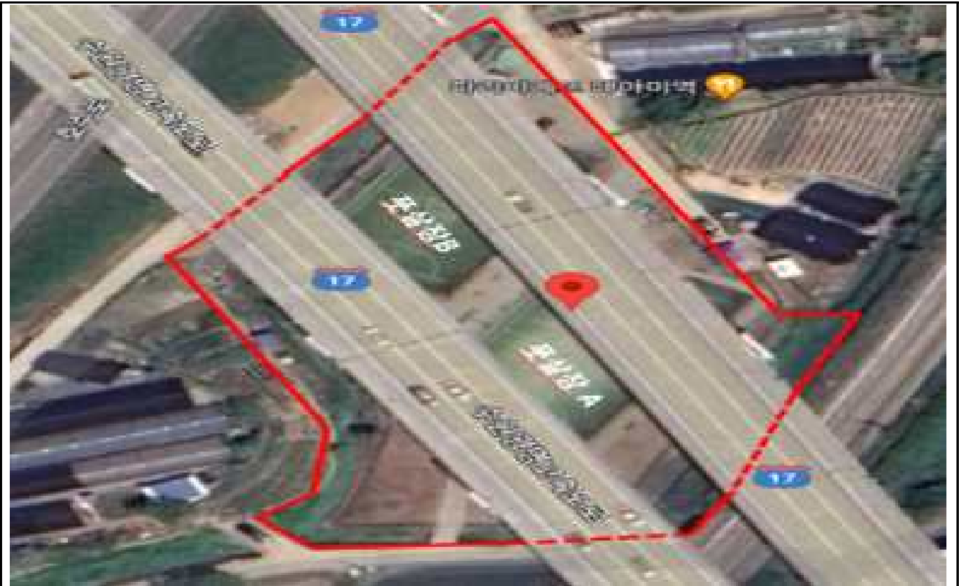
가. 대야미 풋살장(작업면적 4,500㎡)