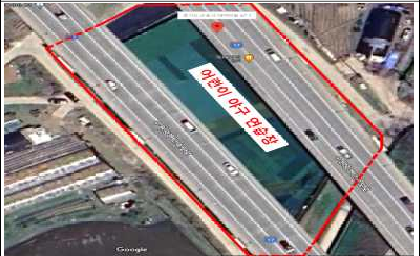
나. 대야미 어린이 야구 연습장(작업면적 6,000㎡)